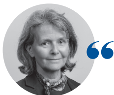
Geneviève VERLEY-CHEYNEL Présidente du tribunal administratif Lyon

L'année 2020 a permis au tribunal de confirmer sa situation particulièrement saine, en dépit de la crise sanitaire liée à la pandémie de Covid-19. Alors que la baisse du nombre de recours enregistrés (- 3,5 %) a été nettement moins marquée que dans le reste du pays (- 8,5 %) et que l'effectif des magistrats s'est trouvé réduit de 10 %, le rythme des affaires jugées s'est maintenu à un niveau particulièrement élevé.