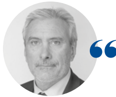
Didier SABROUX Président des tribunaux administratifs de Nouvelle-Calédonie et de Wallis-et-Futuna