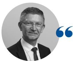
Éric KOLBERT Président de la cour administrative d'appel de Lyon